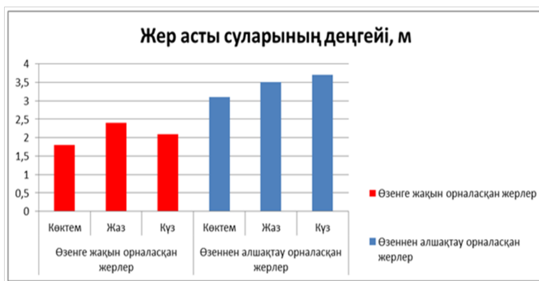
3-сурет – Іле өзені бойындағы тоғай ормандарының жерасты суының деңгейі

1-кестеден және 3-суреттен көрініп тұрғандай, өзеннің жайылмасында немесе өзен аңғары террасасында көктемде жерасты суының деңгейі 1,8 м құрайды және күзге қарай 0,3 м төмендейді және 2,1 м құрайды. Көктемде орталық жайылмада жерасты суының деңгейі 3,1 м құрайды, сонымен қатар күзге қарай 3,7 м дейін төмендейді.