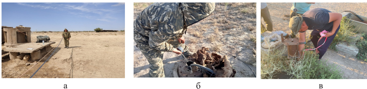
2-сурет – Іле өзені бойындағы тоғай ормандарының жерасты су деңгейлерін зерттеу сәті

Зерттеу бағдарламасы бойынша біз Іле өзенінің жайылмасының екі бөлігіндегі жерасты суының деңгейіне: өзен аңғарына және орталық бөлігіне бақылау жүргіздік. Осы мақсатта барлап зерттеу жұмыстары жүргізіліп, осы террасаларға салынған ұңғымалар табылды. Үлгілерді алу кезеңі көктем, жаз және күз айларында жүргізілді. Ең алдымен өзенге жақын орналасқан жердегі бақылау ұңғымасының жерасты су деңгейі анықталды, ал екінші кезекте өзеннен алшақтау жерде орналасқан бақылау ұңғымасының жерасты су деңгейі анықталды (2-сурет).